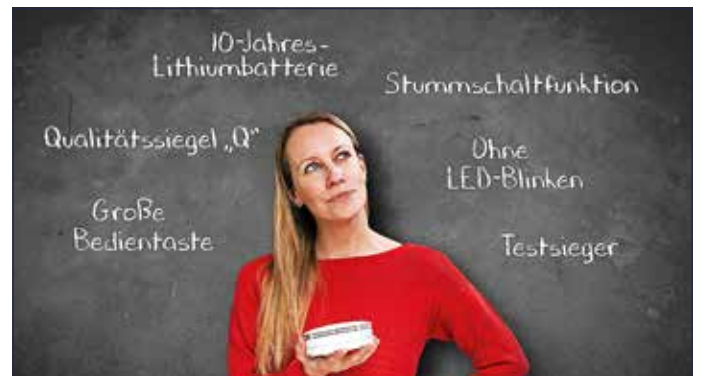
Wer neue Rauchmelder benötigt, sollte beim Kauf einige Qualitätskriterien beachten.

*Quelle: www.gdv.de/gdv/medien/medieninformationen/advent-weihnachten-braende-statistik-184282