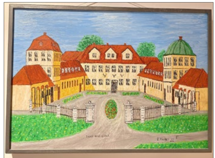
Gemälde E. Fischer, 2002, Seidingstadt

richten Sie bitte telefonisch, unter Nennung Ihrer vollständigen Adresse, an Tel.: 03677 205031 oder schriftlich per E-Mail: post@wittich-langewiesen.de