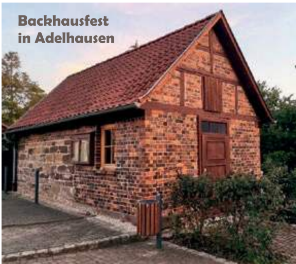
Backhausfest in Adelhausen

Am 09. September 2023 ab 10 Uhr gibt es in Adelhausen wieder Leckereien aus dem Backhaus. Wir bereiten für Euch Zwiebelkuchen und Pizza frisch zu und freuen uns sehr auf Euer Kommen! Euer Heimatverein