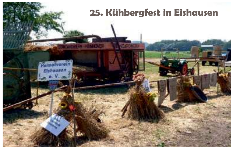
25. Kühbergfest in Eishausen

Am 09. September 2023 ab 10 Uhr gibt es in Adelhausen wieder Leckereien aus dem Backhaus. Wir bereiten für Euch Zwiebelkuchen und Pizza frisch zu und freuen uns sehr auf Euer Kommen! Euer Heimatverein