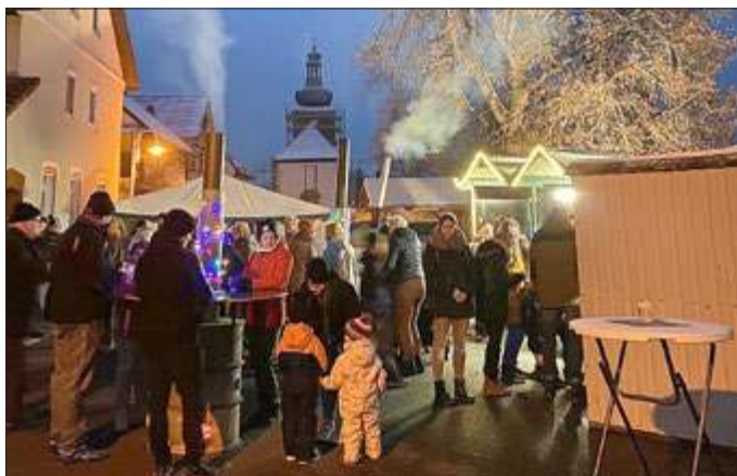
Glühweinmärkte in Linden mit der Dorfgemeinschaft

An allen Ecken und Enden der Gemeinde gab es in der Vorweihnachtszeit kleine oder auch größere Veranstaltungen, wie z.B. das Glühweinmärktle in Linden, Streudorf stimmt ein..., die Dorfweihnacht in Adelhausen, die Nikolausbescherung in Streudorf, die Weihnachtskonzerte in den Kirchen Eishausen und Stresenhausen oder auch ganz spontane Zusammenkünfte, wie in Steinfeld, wo die Einwohner und Gäste zum Plauschen, Musik hören, Schlemmen und gemütlichen Beisammensein eingeladen waren. Vielen, vielen Dank an alle Vereine und Initiativen, die uns diese schöne Adventszeit ermöglicht haben, denn hinter jedem Festchen steht eine Menge Vorbereitungszeit und Engagement, wie die Akteure sicher bestätigen können. Alle Veranstaltungen waren gut besucht, was immer der schönste Lohn für die Mühen im Vorfeld ist. Nun wünschen wir allen Engagierten eine frohe besinnliche Weihnacht mit Zeit zum Auftanken und Kraft schöpfen.