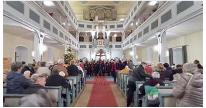
Adventskonzert in der Kirche Eishausen