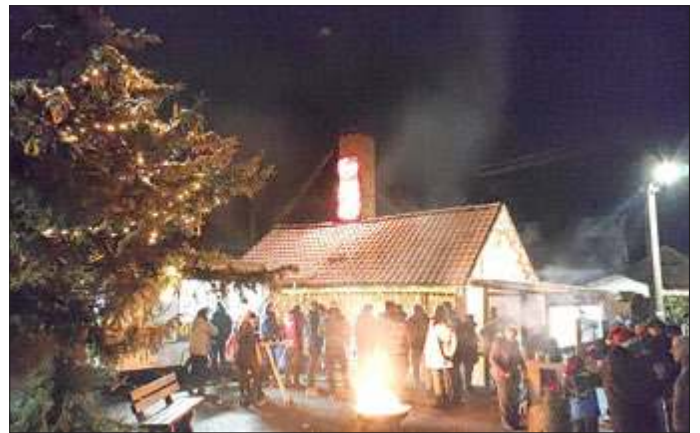
Adventsstimmung am Backhaus in Streudorf mit den Oldtimerfreunden