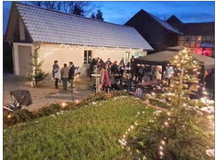
Weihnachtsstimmung in Steinfeld