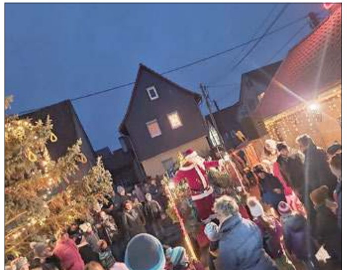
Der Nikolaus kommt in Streudorf